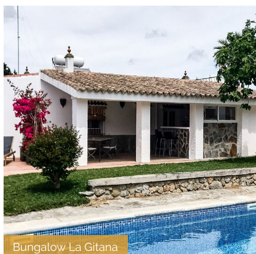
Bungalow La Gitana