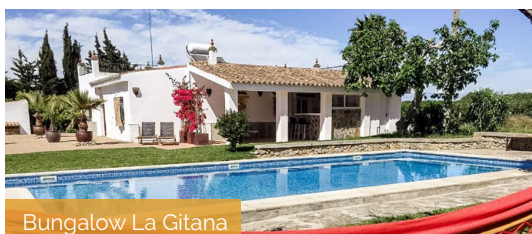
Bungalow La Gitana